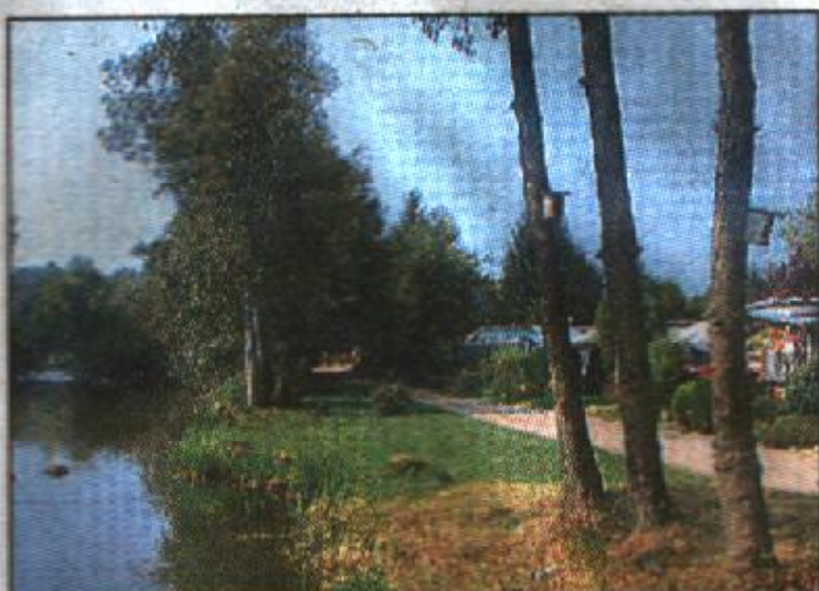
(1) Direkt am Wasser liegt der Campingplatz Laarer See.