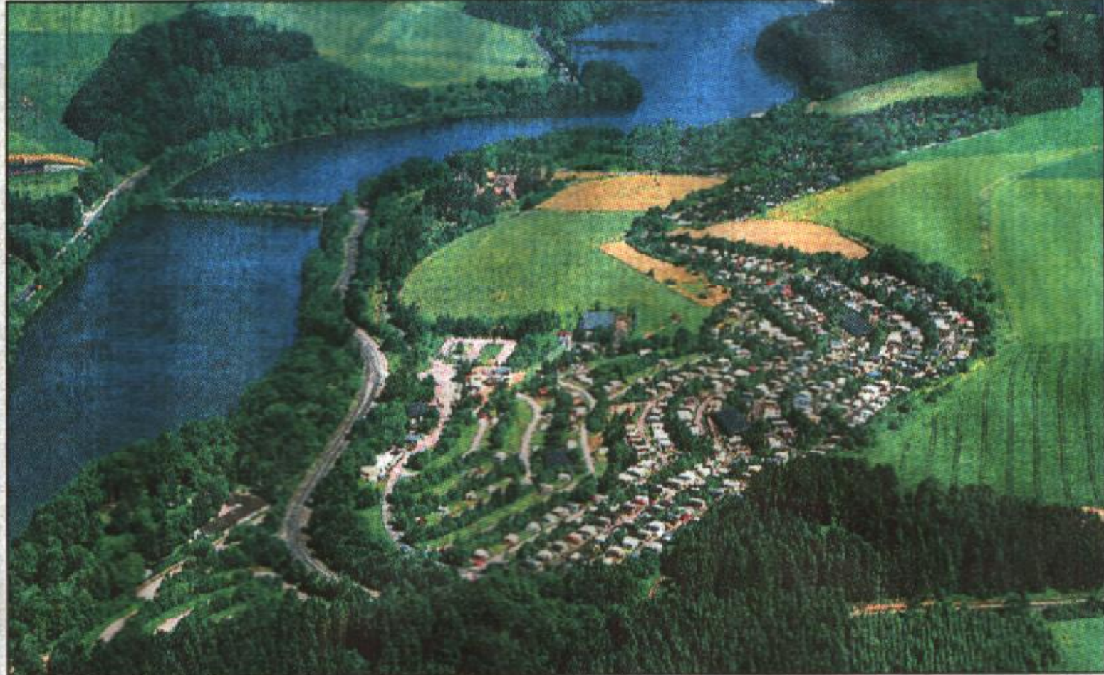
(3) Fast am Ufer des gut acht Kilometer langen Stausees bei Meschede liegt der Campingplatz Hennesee.