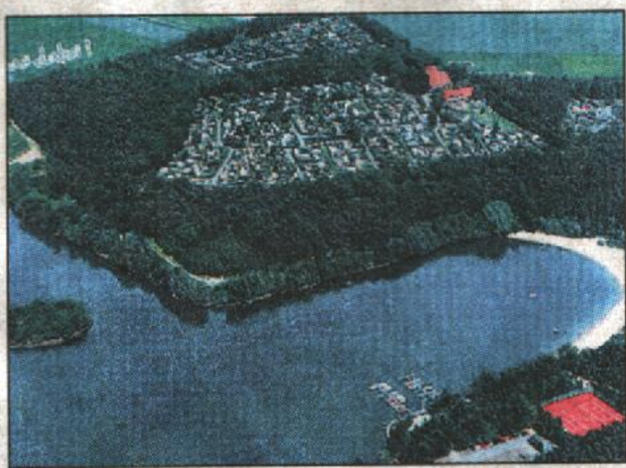
(6) Faul in der Sonne liegen oder surfen – der Feldmarksee neben dem Campingplatz Eichenhof lockt nicht nur Wasserratten.