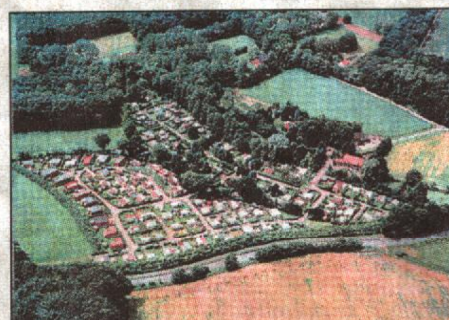
(8) Der Campingplatz Haard feiert runden Geburtstag. Seit 30 Jahren lassen sich hier die Urlauber nieder.