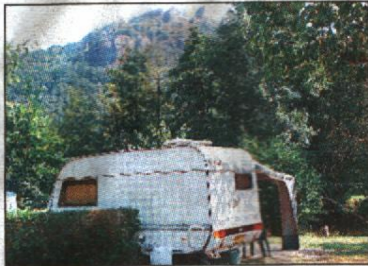
(2) Campingplatz Hetzingen: Ferien im Schatten der Burg Nideggen.