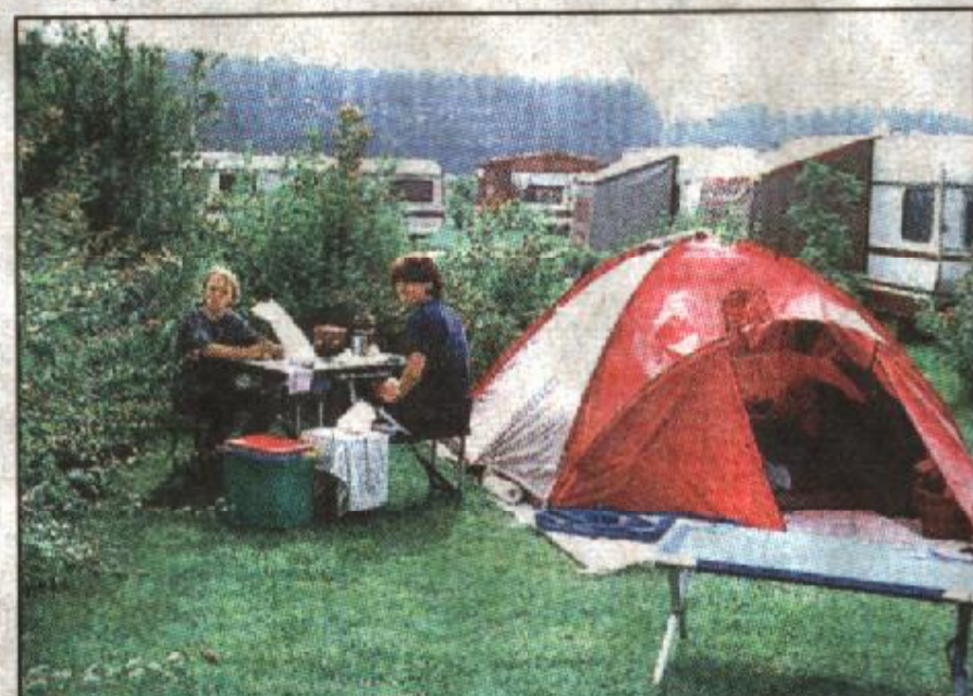
(7) Zum Kerstgenshof gehört nicht nur der Vier-Sterne-Campingplatz, sondern auch ein Bauernhof und ein Streichelzoo.